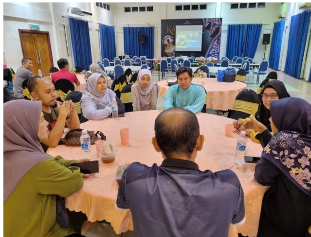
Perbincangan JK Projek bersama pihak Maybank dan MARDI