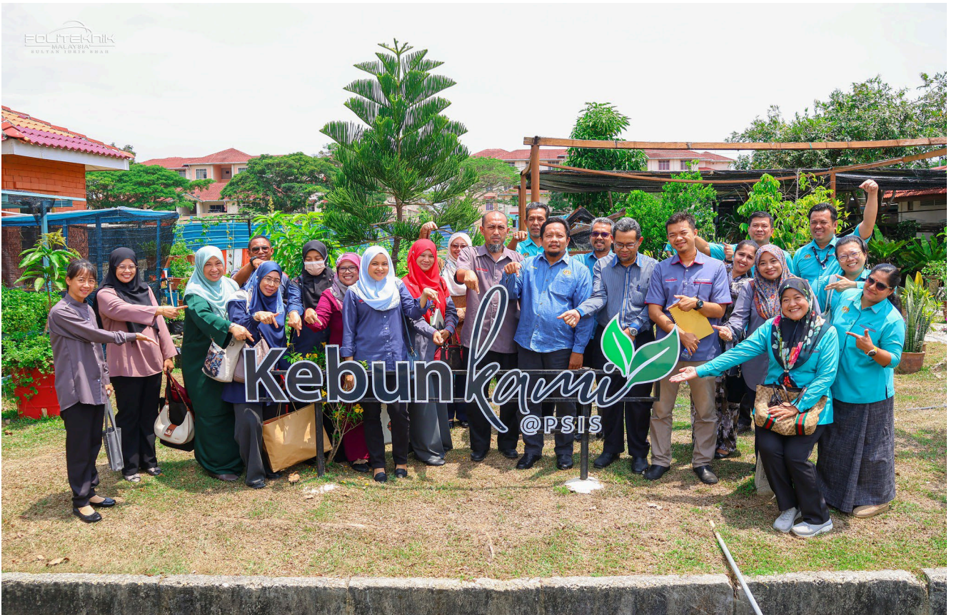
LAWATAN KE KEBUN KAMI