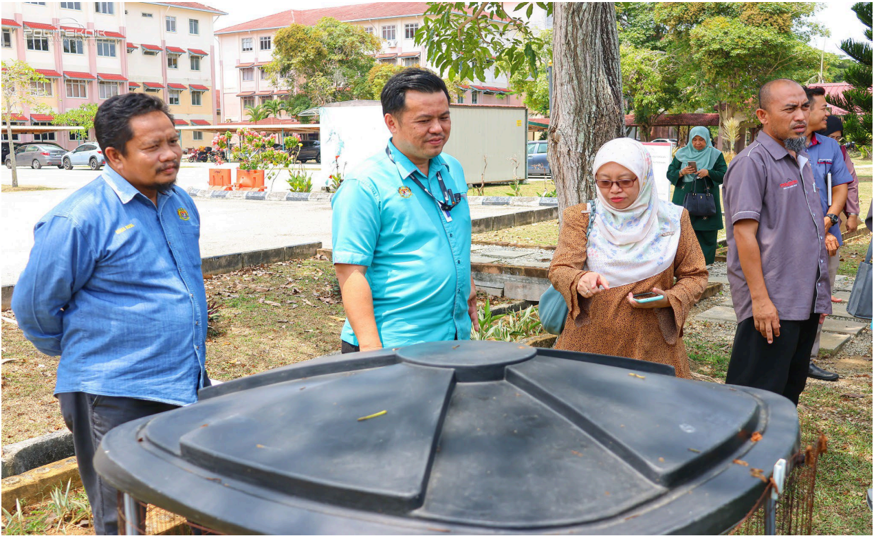
LAWATAN KE KEBUN KAMI