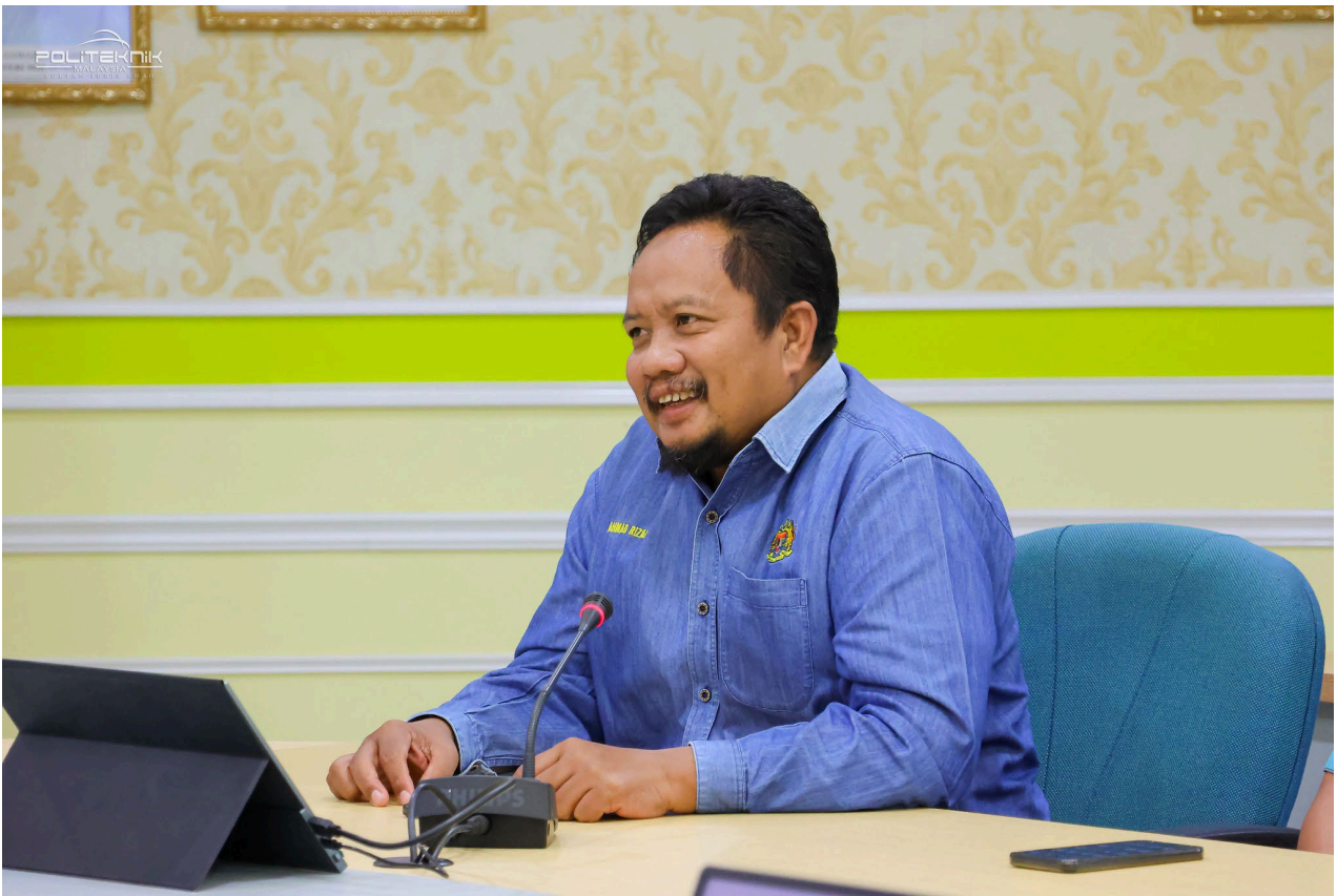
PERBINCANGAN BERSAMA DELEGASI DARI KOLEJ KOMUNITI SUNGAI SIPUT