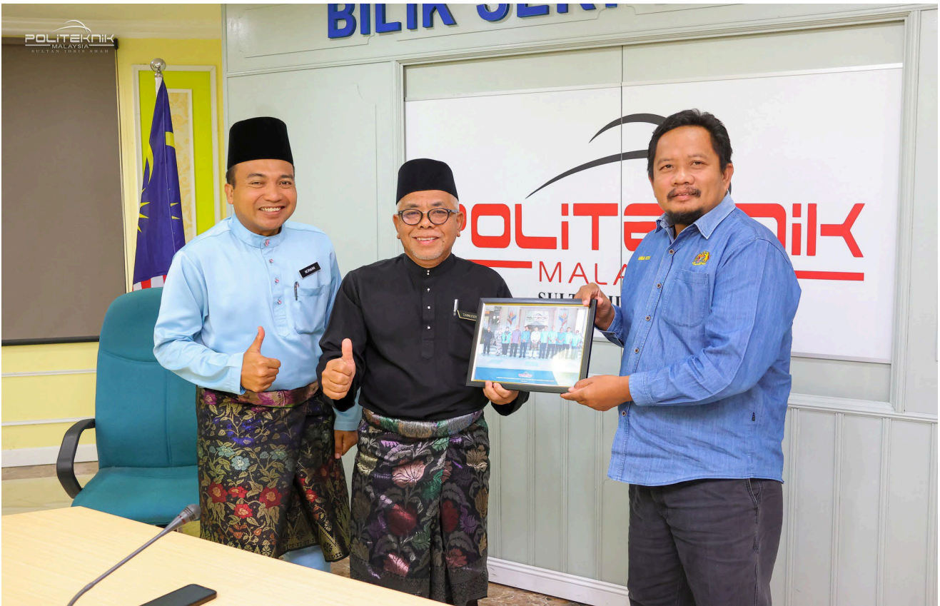
SESI PENYAMPAIAN CENDERAHATI KEPADA DELEGASI KOLEJ KOMUNITI SUNGAI SIPUT