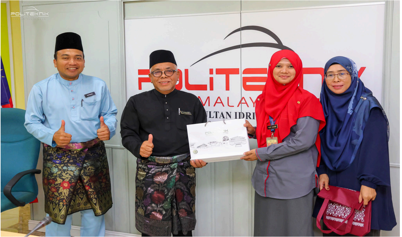
SESI PENYAMPAIAN CENDERAHATI KEPADA DELEGASI PSA