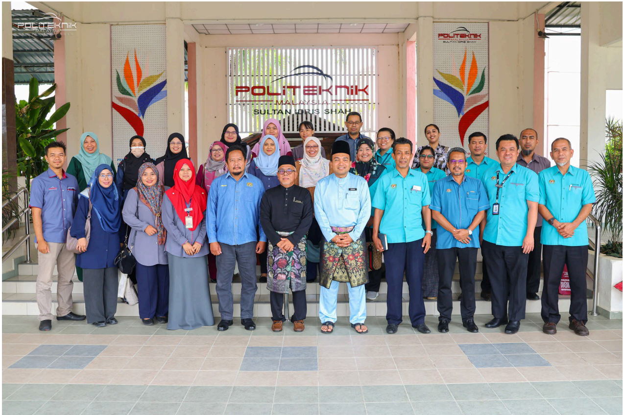
SESI BERGAMBAR BERSAMA DELEGASI DARI KOLEJ KOMUNITI SUNGAI SIPUT DAN POLITEKNIK SALAHUDDIN ABDUL AZIZ SHAH