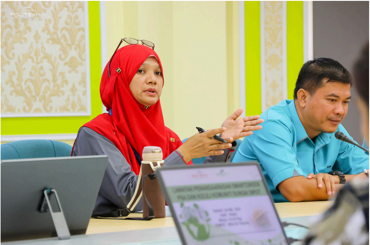
SESI PERTANYAAN DARI JAWATANKUASA SMARTGREEN POLITEKNIK SALAHUDDIN ABDUL AZIZ SHAH