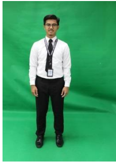
BAJU JENIS KEMEJA