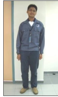
BAJU MAKMAL / BENGKEL (KEMEJA-T BERKOLAR )