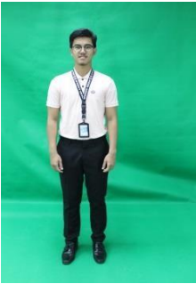
BAJU KEMEJA - T BERKOLAR